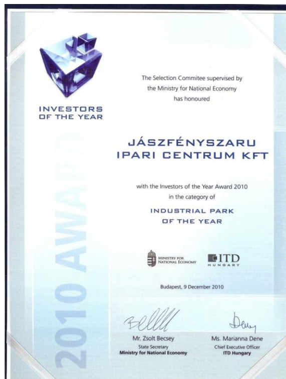
Az Év Befektetője oklevél

A „K+F együttműködésért” díjat a Nokia Siemens Networks (NSN) kapta az ELTE-vel és a BME-vel kötött együttműködéséért. A vállalat évente csaknem egymillió eurót fektet a magyar diplomások képzésébe. A program keretein belül diákok százai kapnak lehetőséget arra, hogy gyakorlati tapasztalatot szerezzenek az NSN laboratóriumaiban Budapesten. A Nokia Siemens Networks budapesti K+F központja az egyik legnagyobb kutatás-fejlesztéssel foglalkozó bázis Magyarországon: a 850 hazai munkavállaló több mint fele ezen a területen dolgozik. A vállalat idén további 100 fejlesztőmérnökkel bővíti tudásközpontját azok után, hogy a Nokia Siemens Networks Budapestet választotta globális vasúti rádiókommunikációs kompetencia-központja székhelyéül.